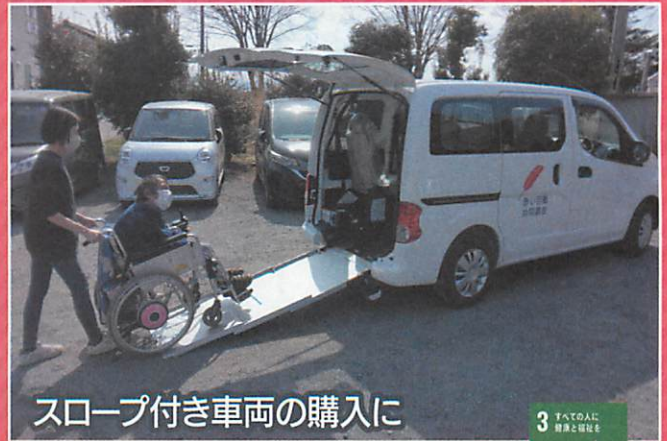
スロープ付き車両の購入に