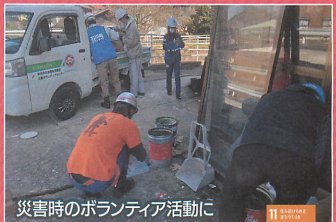
災害時のボランティア活動に