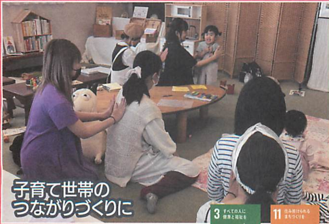
子育て世帯の つながりづくりに