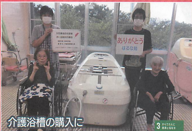
介護浴槽の購入に