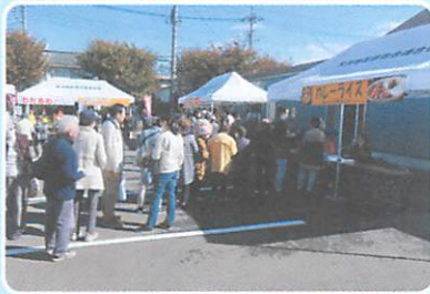
大沢ふれあいフェスタ

会場には、たくさんの方々の笑顔があふれていて、人と人とのふれあいの大切さを改めて感じた一日でした。