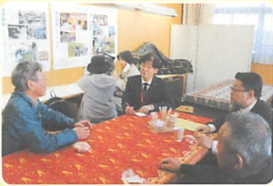
「さくらいカフェ」の様子

子どもお菓子釣りや花植え体験な どを実施したほか、今年度は新たな 試みとして「さくらいカフェ」と称 して、コミュニティ活動の紹介パネルを展 示し、焼き立てのパンと淹れたての コーヒーをふるまい、世代を超えて 地区のみなさんが語りあい・交流する 場を作りました。こうした取り組み が、地域の文化や課題を楽しみなが ら一緒に考えていくきっかけになれ ばと思っています。