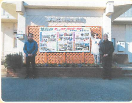
コミ協活動看板の設置

今後、地区センターに足を運んでくださる皆さまに見ていただくとともに、コミ協活動をさらに充実させ、地区の将来像である「豊かな自然と郷土愛あふれる快適なまちづくり」を推進してまいります。