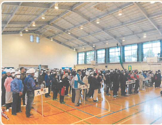
体育館に避難している様子

今年度は、地区総合防災訓練を行 いました。生憎の雨により規模を縮 小しての開催でしたが、火災予防に 関する動画の視聴、応急手当講習、 災害伝言ダイヤルの体験などのブー スを設け、多くの参加者に体験いた だきました。今後も様々な災害に備 えるべく、地区住民の防災意識の高 揚を図れるような防災事業を計画し ていきます。