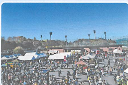
2023 ときめきチャレンジましばやし

令和5年11月19日(日)に増林地 区の一大会イベントである「2023 ときめきチャレンジましばやし」が 開催されました。令和2年度以降は 中止しており、4年ぶりの開催とな りましたが、多数の来場者があり、 大変盛況でした。当日は晴天に恵ま れ、屋外・屋内ステージでの小中学 生や各種団体の発表、フリーマー ケット、子ども工作コーナー、消防 ポンプ車乗車体験、豚汁の販売など、 各種事業を予定通り実施することが でき、子どもから年配の方まで、幅 広い来場者から好評をいただくこ とができました。