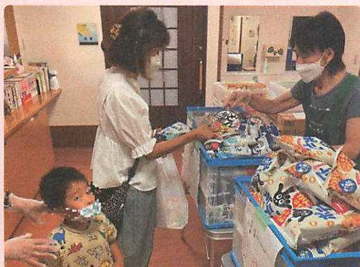
フードパントリー活動に 特定非営利活動法人フードバンクいるま(入間市)