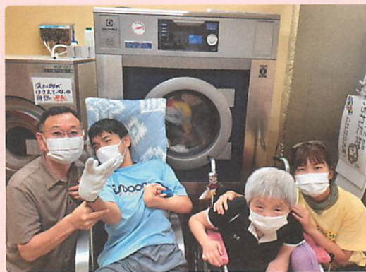
大型洗濯機の購入に 社会福祉法人みぬま福祉会 大地(蓮田市)