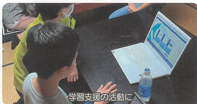
学習支援の活動に