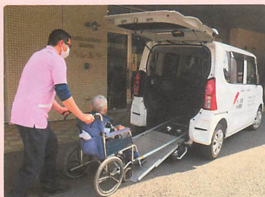
スロープ付き車両の購入に 社会福祉法人ハレルヤ デイサービスセンターハレルヤ(朝霞市)