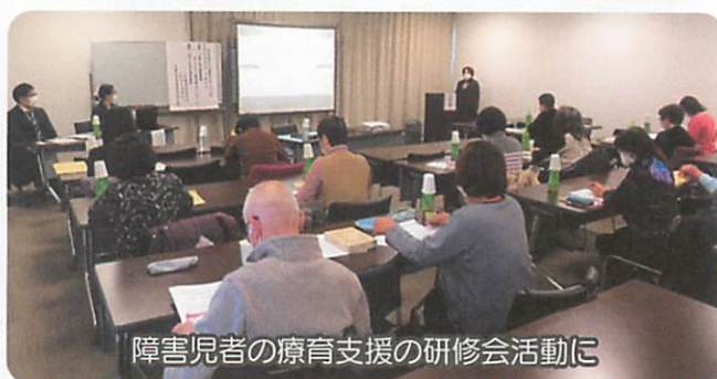
障害児者の療育支援の研修会活動に