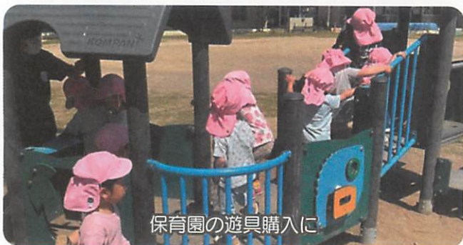
保育園の遊具購入に