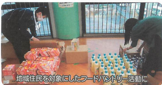
地域住民を対象にしたフードパントリー活動に