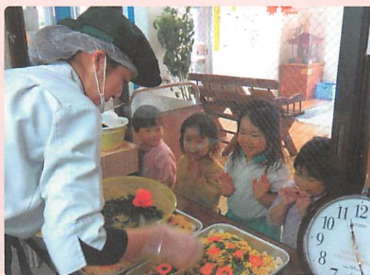
給食室のリフォームに 社会福祉法人呉竹会 児玉の森こども園(本庄市)