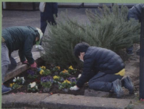
越谷サンシティ花いっぱい活動

今後季節に応じた花を植え、地域の皆さまを楽しませることが出来るよう活動してまいります。