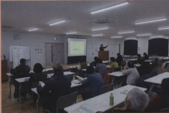
高齢者ふれあいの集い

年4回の開催を予定しており、参加されたみなさんから大変ご好評いただいております。