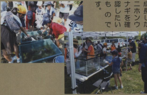
川柳生き物大調査

昨年、仕掛けた石倉カゴと前日に仕掛けた網からモクスガニや外来種のアメリカナマスなどが引き上げられました。以前の調査時にICチップを埋め込んだニホンウナギも含め、9匹確認できました。今年度は子どもたちにニホンウナギのICチップ埋込み体験をしてもらいました。来年の調査時に成長したニホンウナギを確認したいものです。