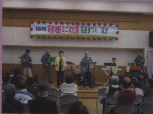
ミニ文化祭&荻島まつり「気分」

感染拡大防止のためできることは限られていましたが、3年ぶりの開催に出演者、参加者とも大変充実した表情でとても楽しそうに過ごしていたのが印象的でした。「荻島まつり」「気分」では、1,000枚の抽選券がほぼ完売し、公民館だよりの紙面上での当選発表としたため3密もなくコロナ禍ならではの楽しみ方で地域の連帯感が高まりました。