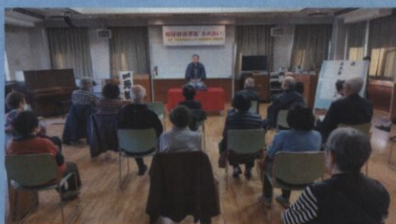
北越谷地区福祉推進事業『ふれあい』

ご参加いただいた方はもちろん、ご協力いただいた講師の方、地区の皆様ありがとうございました。