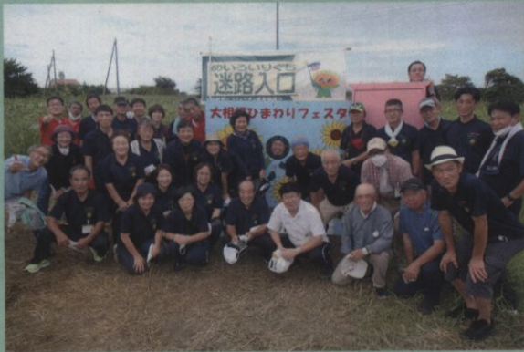
大相模ひまわりフェスタ

今回はひまわり迷路や模擬店のほか、コミ協会員が手作りした顔出しパネルを会場に設置し、多くの方が記念撮影を行いました。また、会場には大相模地区コミ協のマスケットキャラクター「ひまわりくん」も登場して、会場を盛り上げました。