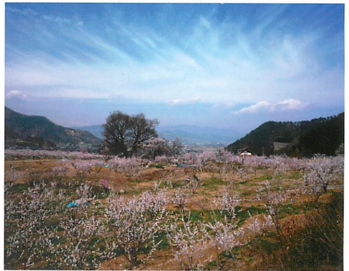
あんずの里スケッチパークからの眺望 明仁上皇ご夫妻が平成25年4月15日ご来訪

往) 地元 = <上信越道> = 戸倉上山田 (昼食) 姨捨の棚田と長楽寺 または ご希望の観光地 ~ 戸倉上山田温泉・湯楽ゆうざん 復) 湯楽ゆうざん ~ ①初夏のあんずやさくらんぼ、夏の桃や葡萄 秋のりんごやキノコ、晩秋の長いもなどのフルーツ狩りやお買い物 ②春の桜の名所や秋の紅葉の名所 ~ 軽井沢 (昼食) ~ 地元 ※上高地・戸隠神社・安曇野などへもプラス料金でご案内